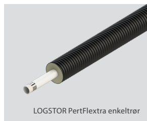
LOGSTOR PertFlextra enkeltrør

Dimensioner på medierør 25-63 mm og kappedimensioner er 90-180 mm.