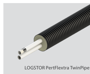
LOGSTOR PertFlextra TwinPipe